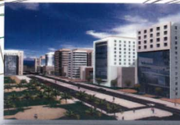
VUE DU PARC URBAIN