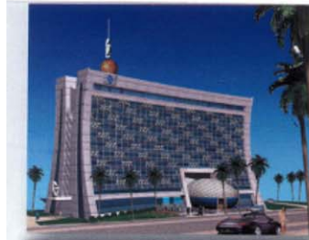
SIEGE ATM MOBILIS