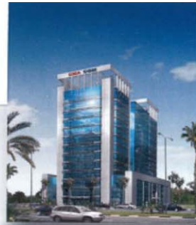
SIEGE CMA - CGM