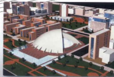
PALAIS DES CONGRES