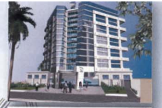
SIEGE ALGERIE POSTE